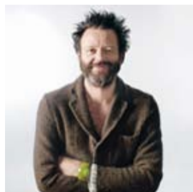
7— Trussardi.MY Design