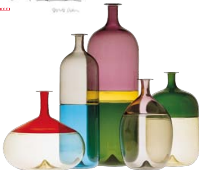
11— 1921-2011: i 90 anni di Venini