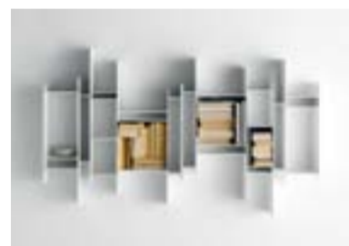
9— 2011 Collection