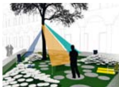
9— Interni Mutant Architecture&Design