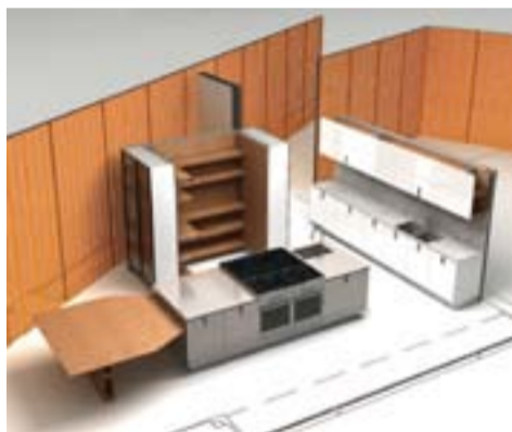
5— Set in Motion