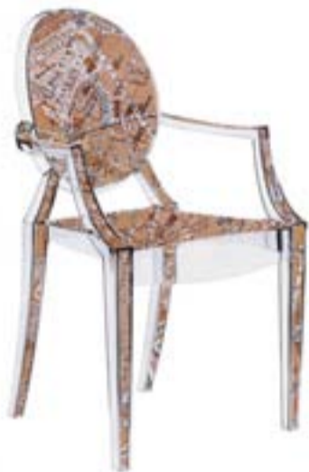
3— Progetto speciale