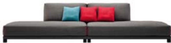
8— Natuzzi Open Art