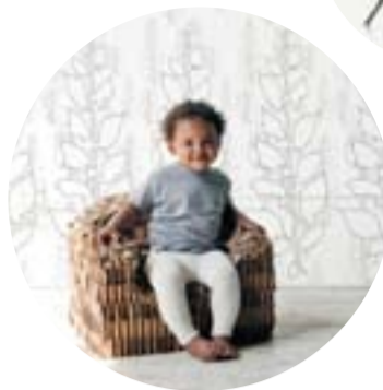
2— Design for kids