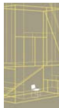
6— Immaterial House