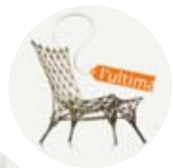
1— 1000 e una Knotted Chair