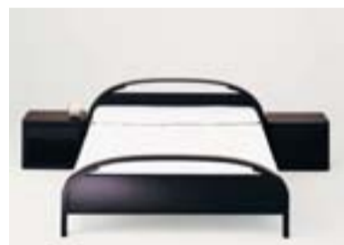
7— 1971-2011. Quarant'anni di design d'autore