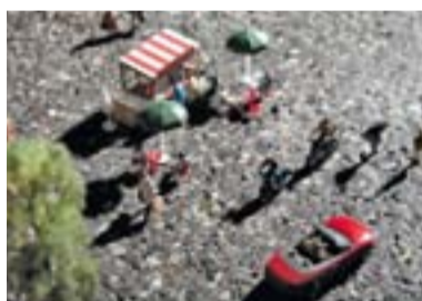
8— Dna Urbano