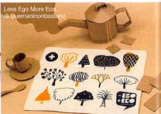
Less Ego More Eco, di Duemaninonbastano