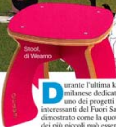
Stool, di Wearno